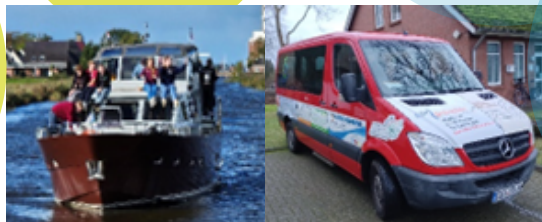
Bootsfreizeit 2019 und Mercedes Sprinter

Gestaltungsraum für eigene Ideen und Schwerpunkte